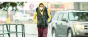
TIJUANA.- Se pide a la población mantenerse resguardada de los vientos helados que continuarán durante la semana.