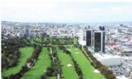
TIJUANA.- La Justicia Federal negó los argumentos de los representantes legales, porque el gobierno estatal se apega a la ley.